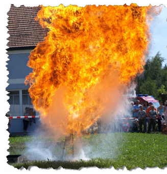
Tag der offenen Tür